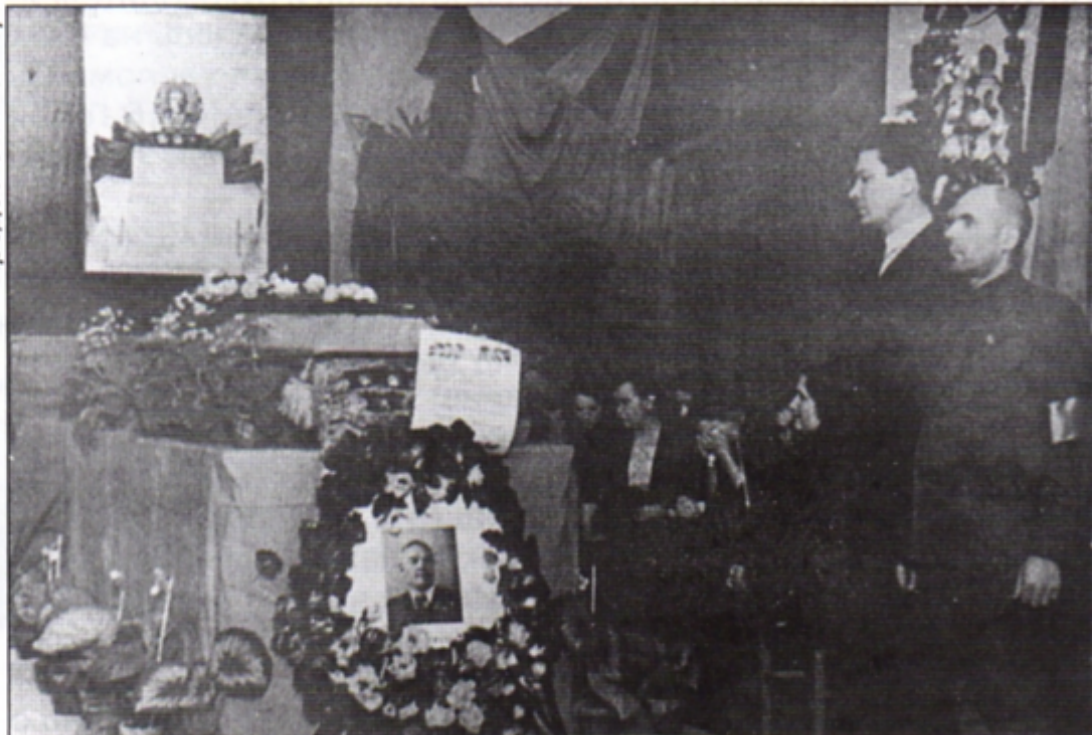
Церемония прощания с В.М. Петляковым. Казань, январь 1942 г.

V.M. Petlyakov's funeral. Kazan, January 1942